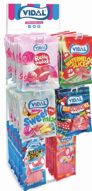
Espositore caramelle gommoso Vidal.