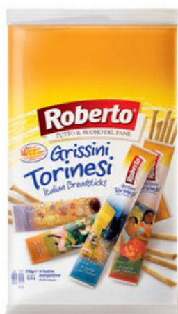
Grissini Torinesi monoporzione.