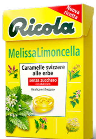
Caramelle Ricola alla menta di montagna.