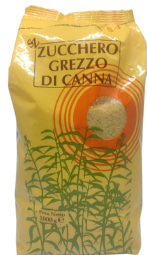
Zucchero grezzo di canna.