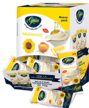
Maionese in bustine monodose.