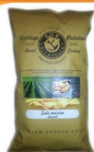
1 BUSTA VINTAGE SALE MARINO GR.300