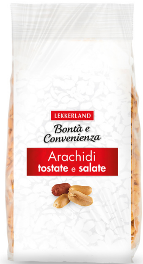
Arachidi tostata e salate.