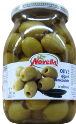
Olive denocciate Novella.