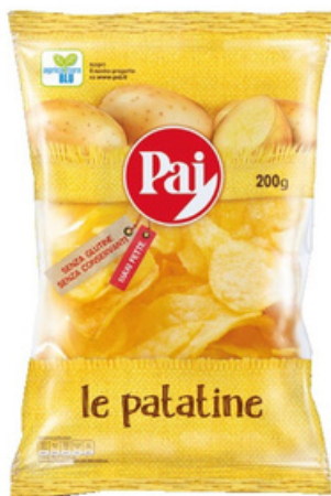
Patatine assortite Pai.