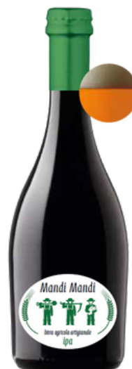
Birra agricola artigianale Mandi Mandi ipa.