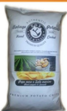
1 BUSTA VINTAGE PEPE NERO GR.300