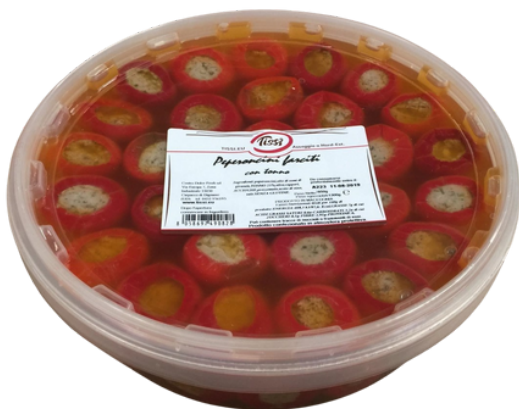
Peperoncini farciti con tonno Tissi.