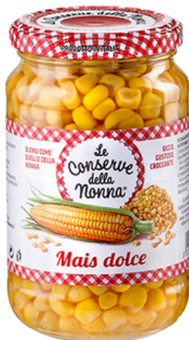
Mais dolce Conserve della Nonna