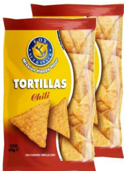
Patatine tortillas al gusto chili.