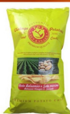
1 BUSTA VINTAGE ACETO BALSAMICO GR.300