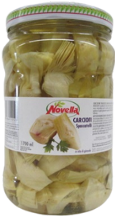
Carciofi spaccati sott'olio Novella.