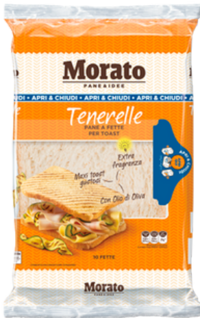
Tenerelle Morato pane a fette per toast.