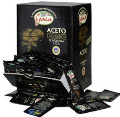
Aceto balsamico di Modena IGP in bustine monodose.