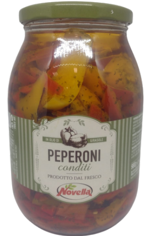
Peperoni alla veneta Novella.