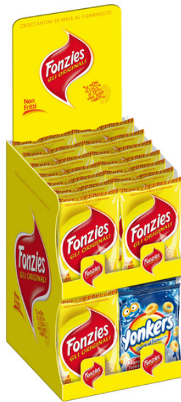
Espositore patatine Fonzies e Yonkers.