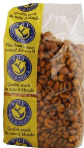
Mais tostato piccante Fox.