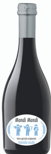
Birra agricola artigianale Mandi Mandi bionda cruda.