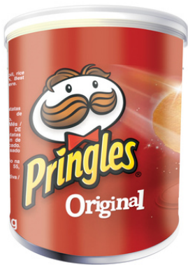
Patatine Pringles in vari gusti.