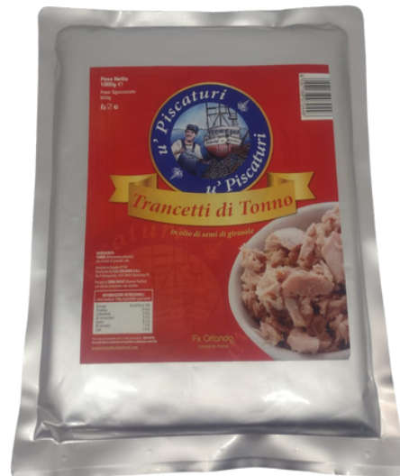
Tonno in busta in olio.