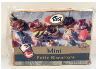
Mini fette biscottate Tissi.