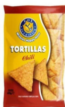
1 BUSTA TOR TILLAS CHILI GR.450