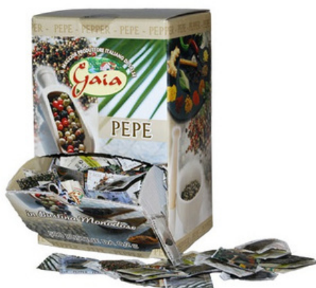
Pepe in bustine monodose.