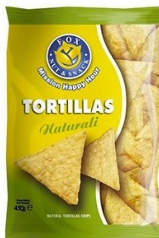
Patatine tortillas naturali.