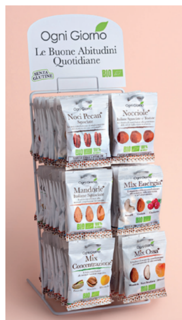
Espositore di frutta secca bio assortita: nocciole, mandorle, noci pecan e tre diversi mix.