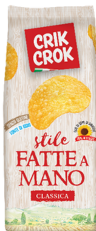
Patatine stile fatte a mano Crik Crok.