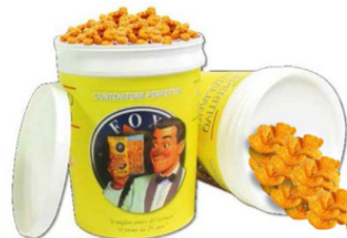
1 VASO RICE CRACKERS GR.1000