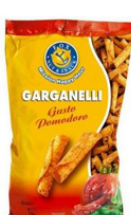
1 BUSTA GARGANELLI GR.300