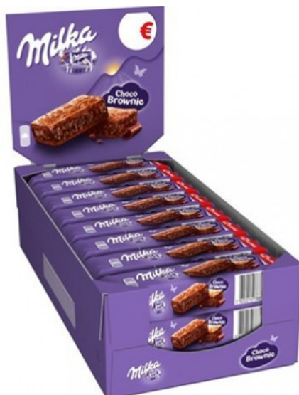
Choco brownies Milka.