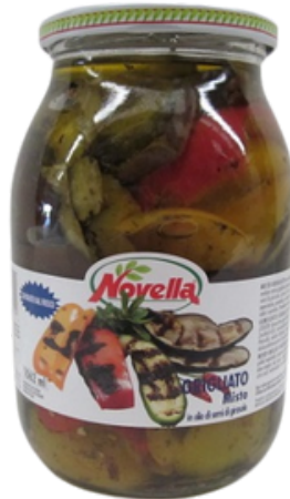
Verdure miste grigliate sott'olio Novella.