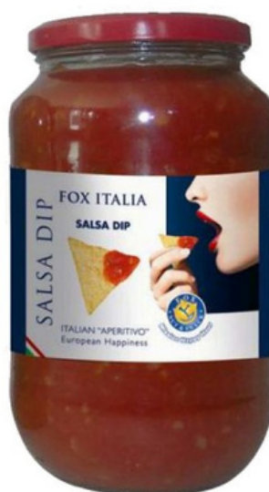
Salsa dip Fox.