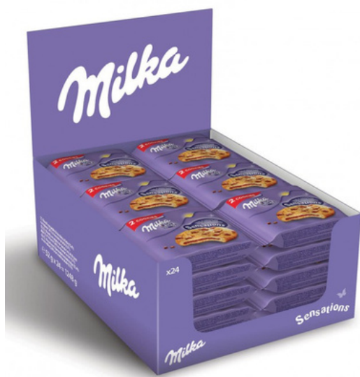
Biscotti Milka cookies con gocce di cioccolato.