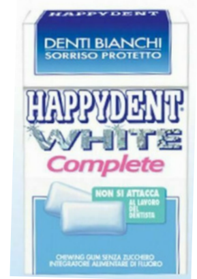
Chewingum happydent white complete senza zucchero.