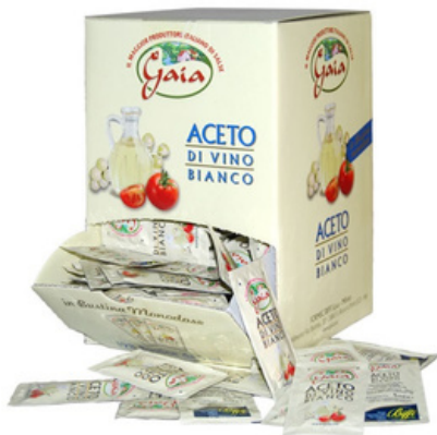
Aceto di vino bianco in bustine monodose.