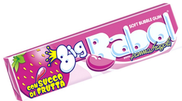
Bubble gum Big Babol alla panna e fragola.