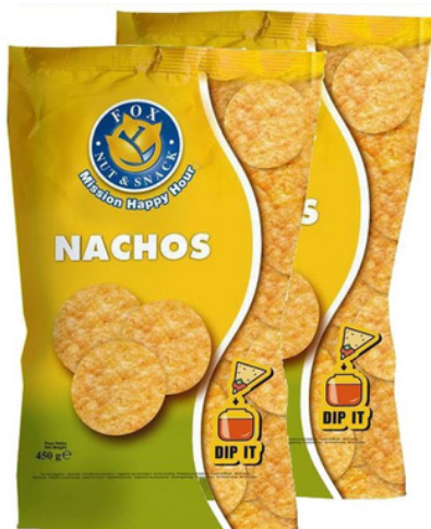
Patatine nachos Fox.