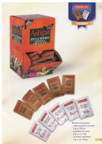
Zucchero in bustine.