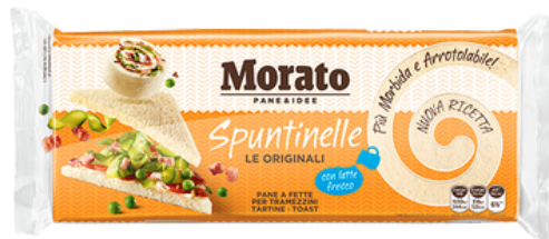
Spuntinelle Morato pane a fette per tramezzini.