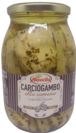
Carciogambo alla romana Novella.