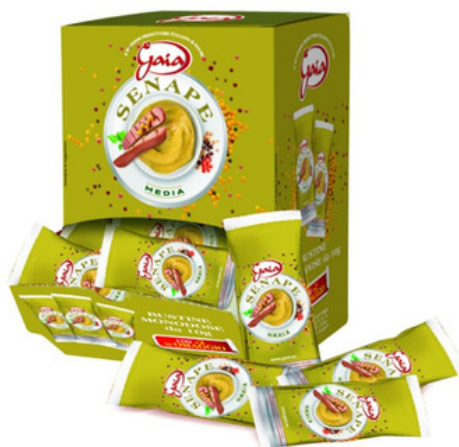
Senape in bustine monodose.