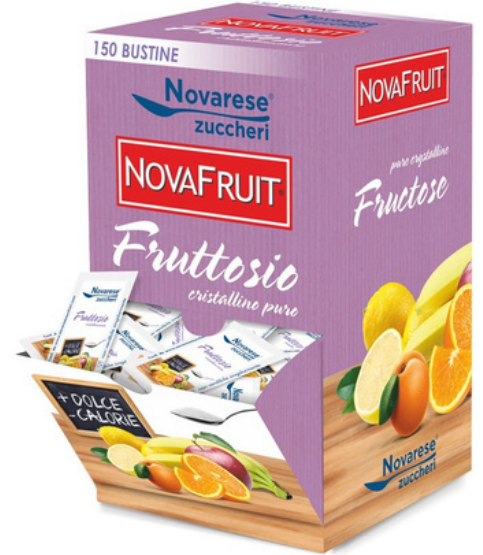
Fruttosio cristallino puro.