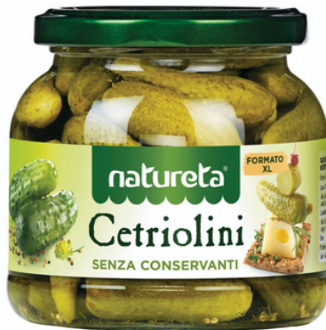
Cetriolini sott'aceto Natureta.