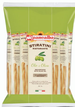
Grissini all'olio di oliva monoporzione.