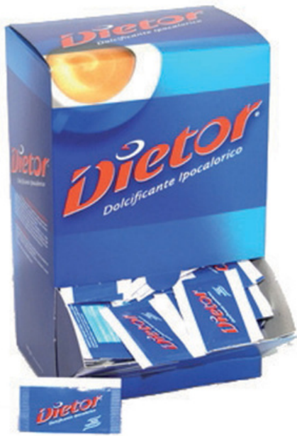
Dolcificante ipocalorico Dietor.