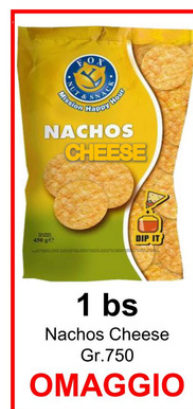
1 bs Nachos Cheese Gr.750 OMAGGIO

Assortimento misto di patatine e snack Aperiprimavera Fox.