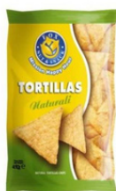
1 BUSTA TORTILLAS NATURALI GR.450