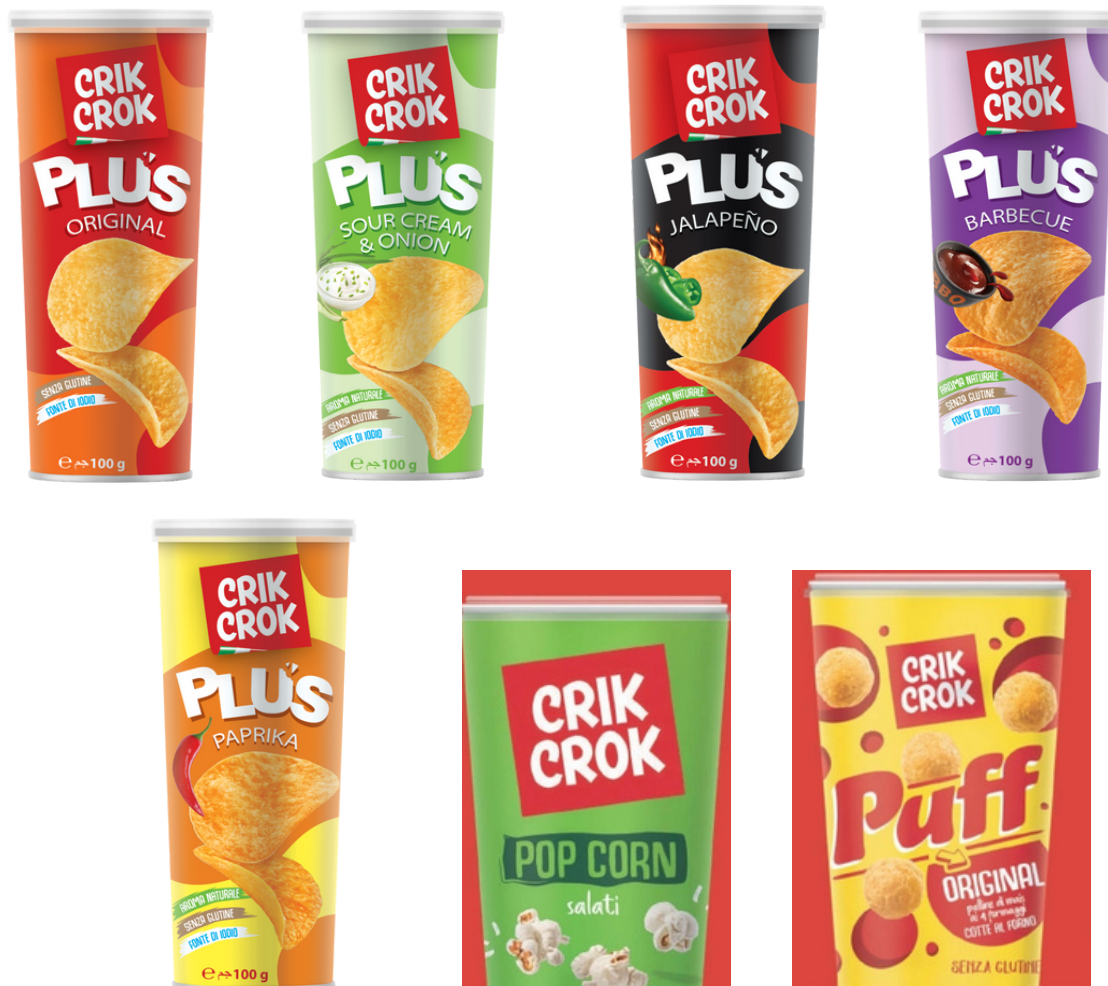
Patatine assortite in tubo Crik Crok.