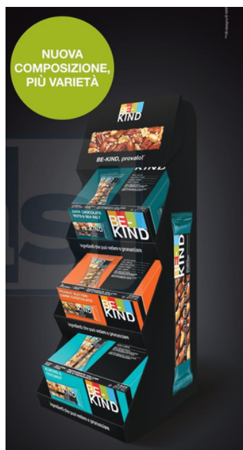
Espositore barrette Be-kind assortite con frutta secca e cioccolato, cocco o burro d'arachidi.