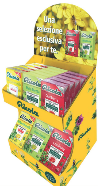
Espositore caramelle Ricola assortite alla frutta.