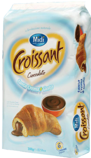
Croissant al cioccolato.