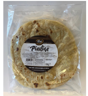
Piadina con olio extra vergine di oliva Tissi.