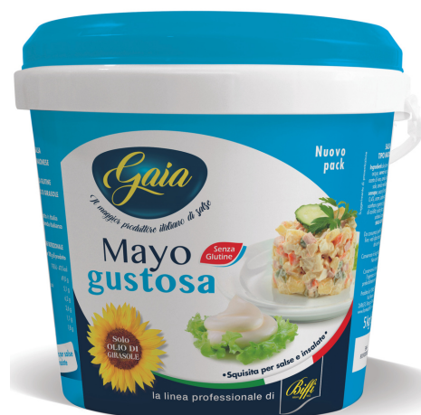
Maionese gustosa Gaia.