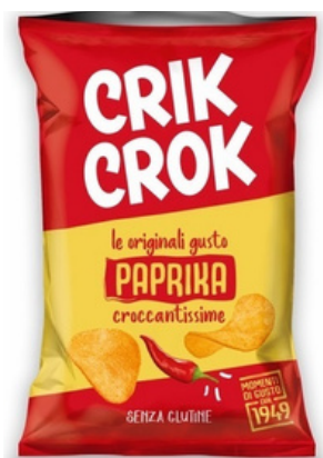
Patatine al gusto paprika Crik Crok.