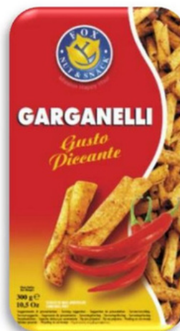
Patatine garganelli al gusto piccante.