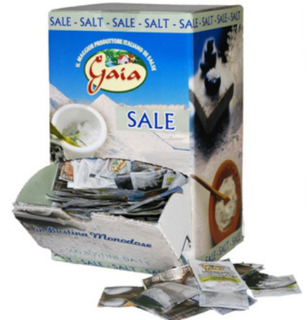
Sale in bustine monodose.