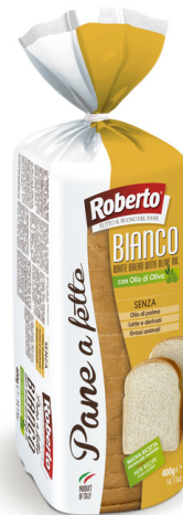
Pane affettato bianco con olio d'oliva Roberto.