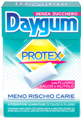
Chewingum daygum protex senza zucchero.