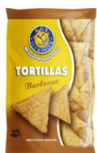
1 BUSTA TORTILLAS BBQ GR.450