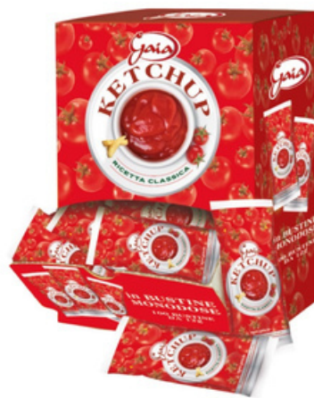
Ketchup in bustine monodose.