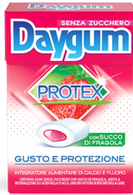
Chewingum daygum protex con succo di fragola.