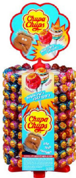
Ruota di Chupa Chups assortiti.