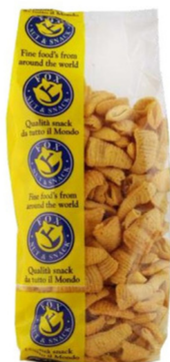
Patatine cornetti Fox.