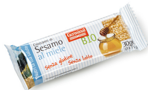
Barrette croccanti di sesamo al miele, senza glutine.