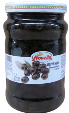
Olive nere denocciate Novella.