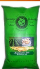
1 BUSTA VINTAGE ROSMARINO GR.300