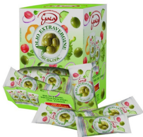
Olio EVO in bustine monodose.