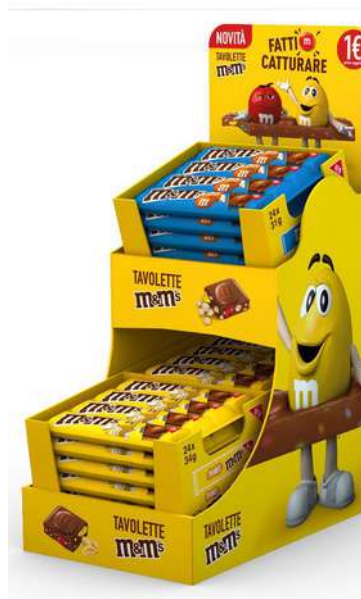
Espositore tavolette al cioccolato con m&m's.