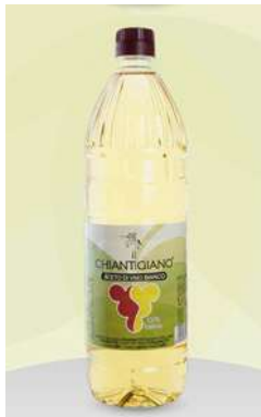
Aceto di vino bianco Chiantigiano.