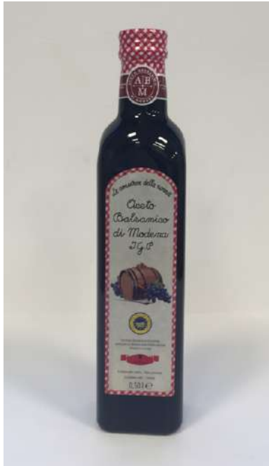
Aceto balsamico di Modena I.G.P.