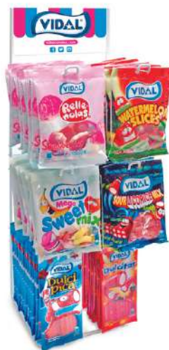
Espositore da banco caramelle Vidal.