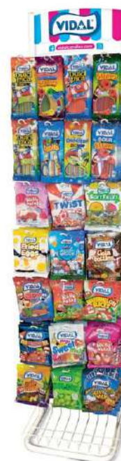
Espositore da terra caramelle Vidal.