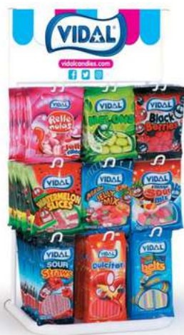
Espositore da banco caramelle Vidal.