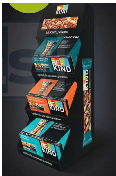
Espositore barrette alla frutta secca Be-kind.