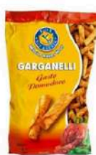
1 BUSTA GARGANELLI GR.300