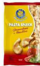
1 BUSTA PASTA SNACK GR.250