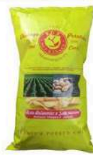
1 BUSTA VINTAGE ACETO BALSAMICO GR.300