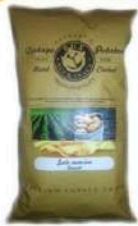
1 BUSTA VINTAGE SALE MARINO GR.300