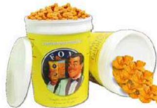
1 VASO RICE CRACKERS GR.1000