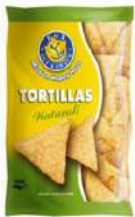
1 BUSTA TORTILLAS NATURALI GR.450