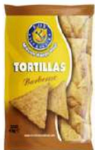
1 BUSTA TORTILLAS BBQ GR.450