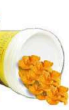
1 VASO CORNETTI GR.500