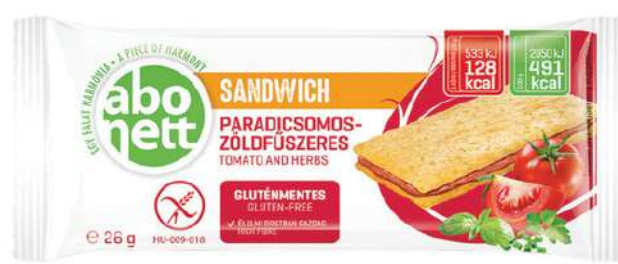
Sandwich al pomodoro Senza glutine