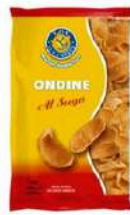
1 BUSTA ONDINE GR.250