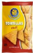
1 BUSTA TORTILLAS CHILI GR.450