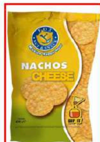
1 bs Nachos Cheese Gr.750