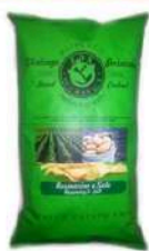
1 BUSTA VINTAGE ROSMARINO GR.300