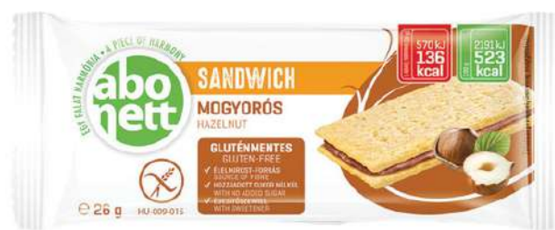
Sandwich alla nocciola Senza glutine