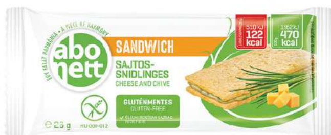
Sandwich al formaggio ed erba cipollina Senza glutine