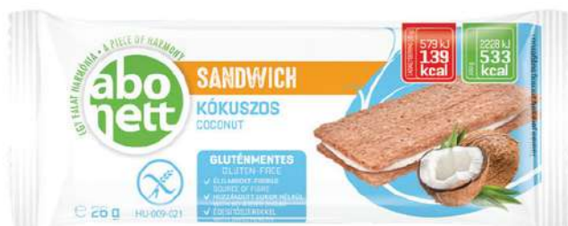
Sandwich al cocco Senza glutine