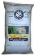
1 BUSTA VINTAGE PEPE NERO GR.300