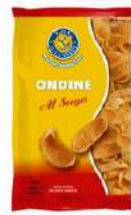
1 BUSTA ONDINE GR.250