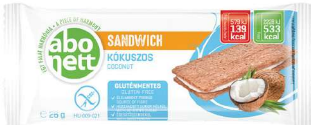
Sandwich al cocco Senza glutine