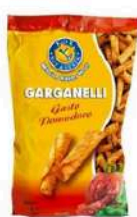
1 BUSTA GARGANELLI GR.300