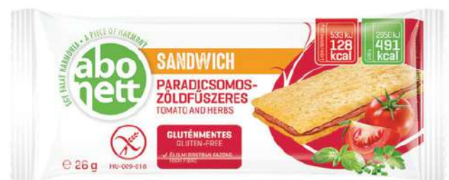
Sandwich al pomodoro Senza glutine