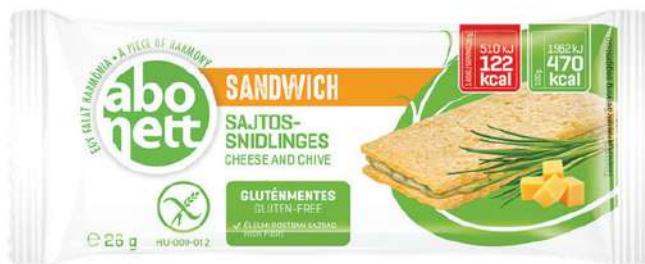
Sandwich al formaggio ed erba cipollina Senza glutine