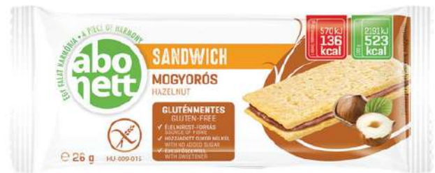
Sandwich alla nocciola Senza glutine