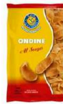
1 BUSTA ONDINE GR.250